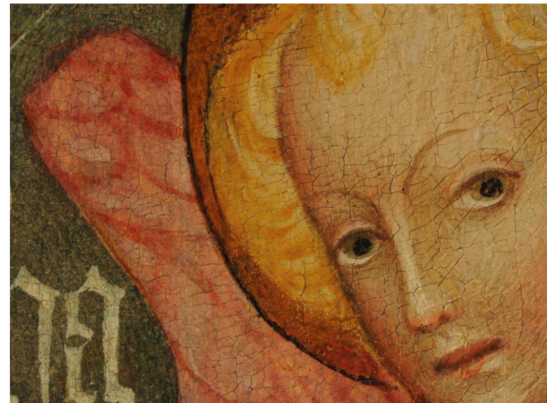
Paroto, Madonna dell'Umiltà e santi , insieme e dettagli